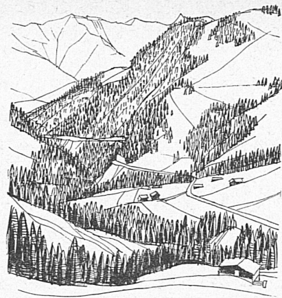
Au col des Mosses.

Suivons le cours de cette rivière. Il nous conduira vers notre point de départ par Gstaad, la grande annexe hôtelière de Gessenay (ou Saanen), chef-lieu agreste de la Haute-Gruyère, aux monumentales mai-