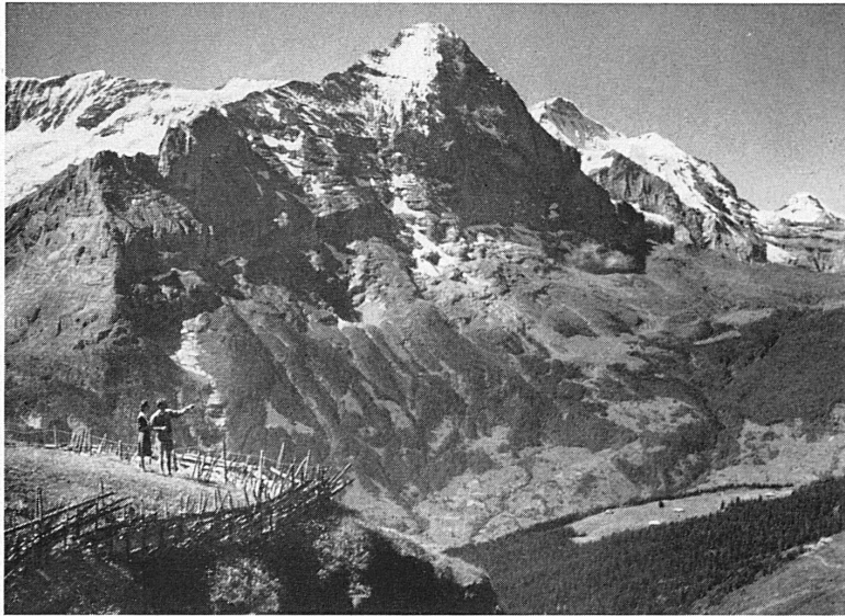
Ausblick von First gegen Eiger und Jungfrau