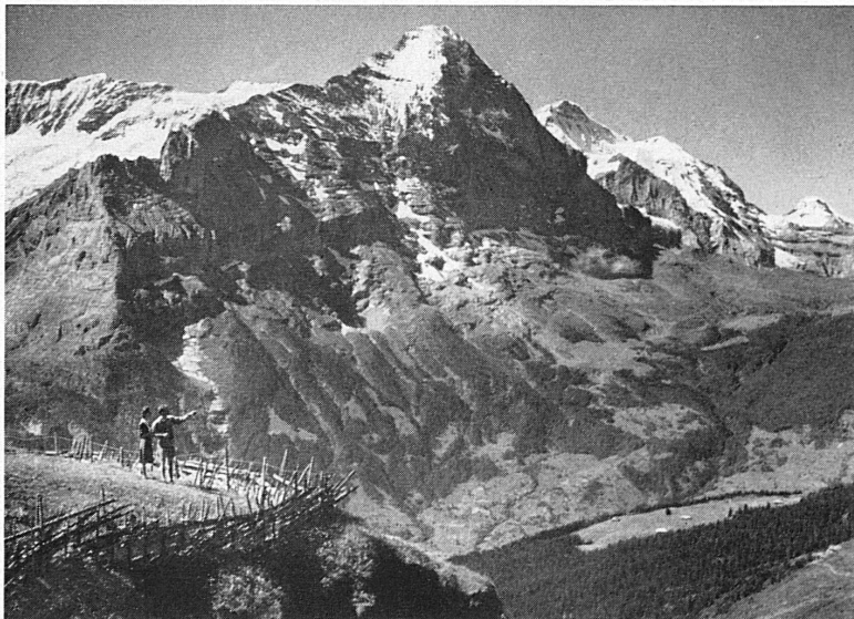
Ausblick von First gegen Eiger und Jungfrau