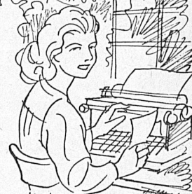
ÉCOLE DE COMMERCE