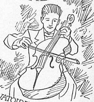
CONSERVATOIRE DE MUSIQUE