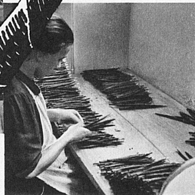
die richtige Kontrolle