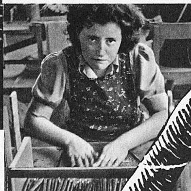
das richtige Deckblatt