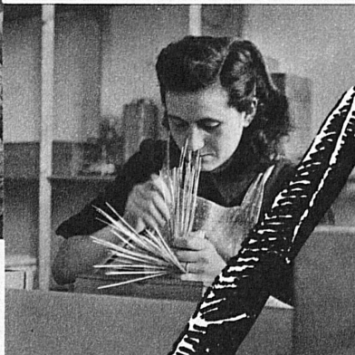
das richtige Hälmlí