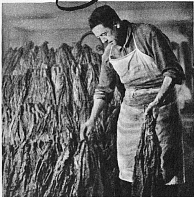
der richtige Tabak