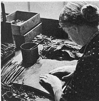
die richtige Einlage