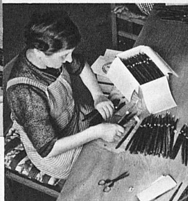
die richtige Verpackung

... der Fabbrica Tabacchi in Brissago Blauband Brissago