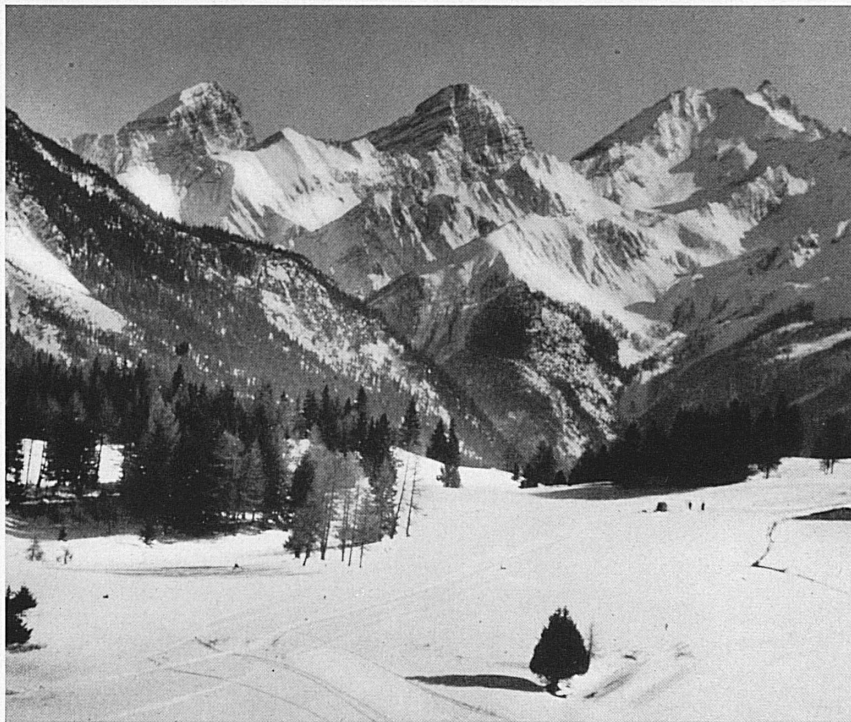
Das Skigelände der Lenzerheide mit Aussicht gegen die Berggünsterstöcke. — La région de ski de Lenzerheide avec vue sur les Berggünsterstöcke.