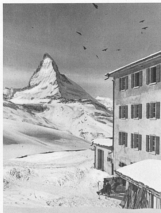
En haut : L'Hôtel Riffelberg et le Cervin. — Oben: Das Riffelberg-Hotel mit dem Matterhorn.

A gauche : Coup d'œil du Schwarzsee sur le Riffelberg et la contrée du Gornegrat; au fond, le Mont Rose. — Links: Blick vom Schwarzsee aus ins Riffelberg- und Gornegratgebiet; im Hintergrund der Monte Rosa.