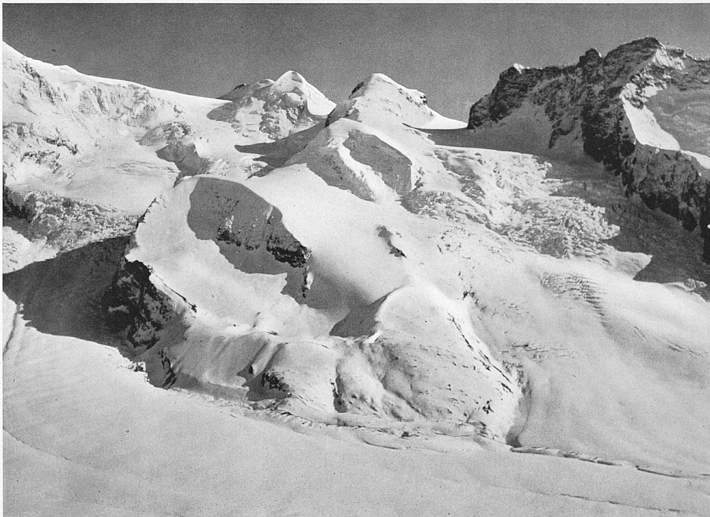
En haut : Les Zwillinge forment deux cimes très accentuées dans la région environnant le sud du Gornergrat. — Oben: Die Zwillinge bilden ein markantes Gipfelpaar in der südlichen Umrahmung des Gornergratgebiets.

tique barre l'horizon: le Bietschhorn. Riffelalp: une colonie d'aroles s'en va déposer une guirlande de bronze et d'argent autour du vaste balcon naturel au-dessus duquel un hôtel surgit.