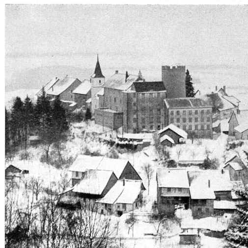
Regensberg, im Zürcherland, ein mittelalterliches Miniatürkstädtchen im Winter.

Le château moyenâgeux de Steckborn (lac de Constance) avec ses imposantes poivrières aux campaniles de style baroque, construites au XVII me siècle.