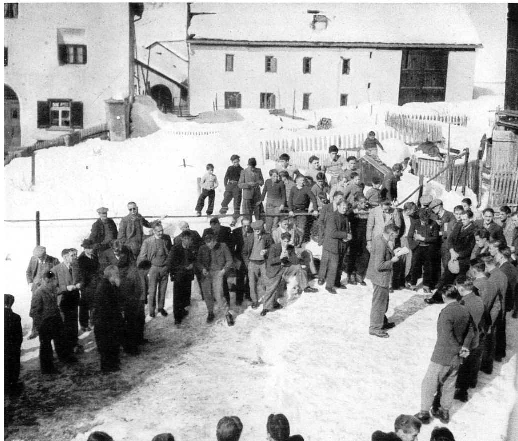
Links: Die Vereidigung des neuen Gemeinderates.

A gauche: L'assermentation des conseillers communaux.