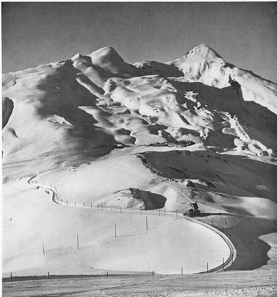
Rechts: Das Schnee-Paradies der Kleinen Scheidegg mit dem Lauberhorn und dem Tschuggen.

Ce sera pour les uns et les autres une excellente occasion de prendre la mesure de leurs forces.