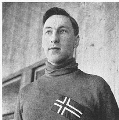
Ivar Ballangrud (Norvège) qui a obtenu trois médailles d'or en 1936, sera présent à Saint-Moritz en 1948.

1896; à cette époque, à part le patinage artistique pratiqué dans plusieurs pays de façon populaire, les sports de neige et de glace étaient en quelque sorte inconnus ou à leurs tout premiers débuts. Ce n'est qu'en 1908, lors des jeux de la IV me Olympiade commémorés à Londres, que figurèrent pour la première fois les sports de glace, sous forme de patinage artistique et de hockey sur glace. Rappelant cet événement, le baron de Coubertin écrit dans ses mémoires: « En 1908, à Londres, les sports de glace, à défaut des sports de neige, furent brillamment représentés. A Stockholm naturellement, ils furent écartés par l'absence même d'un palais de glace et le fait que toute la Scandinavie était hostile alors à l'idée d'un cycle olympique spécial; cette hostilité était en 1924 assez forte encore pour que des menaces de sécession fussent formulées en Norvège. Les jeux de Chamonix ne furent tolérés par nos amis du nord qu'à la condition de ne point porter le nom d'« olympiques ».