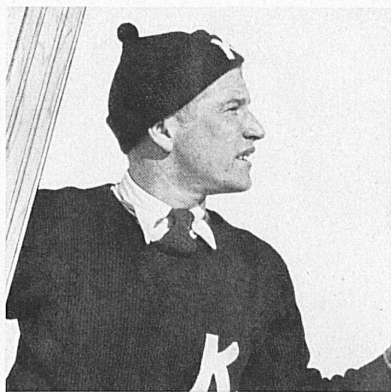
Birger Ruud (Norvège) vainqueur des compétitions de saut aux Jeux olympiques 1932 et 1936. Qu'en sera-t-il à Saint-Moritz?

Quant aux IV mes Jeux olympiques d'hiver servant de prélude à la célébration de la XI me Olympiade qui eut lieu à Berlin en 1936, ils se