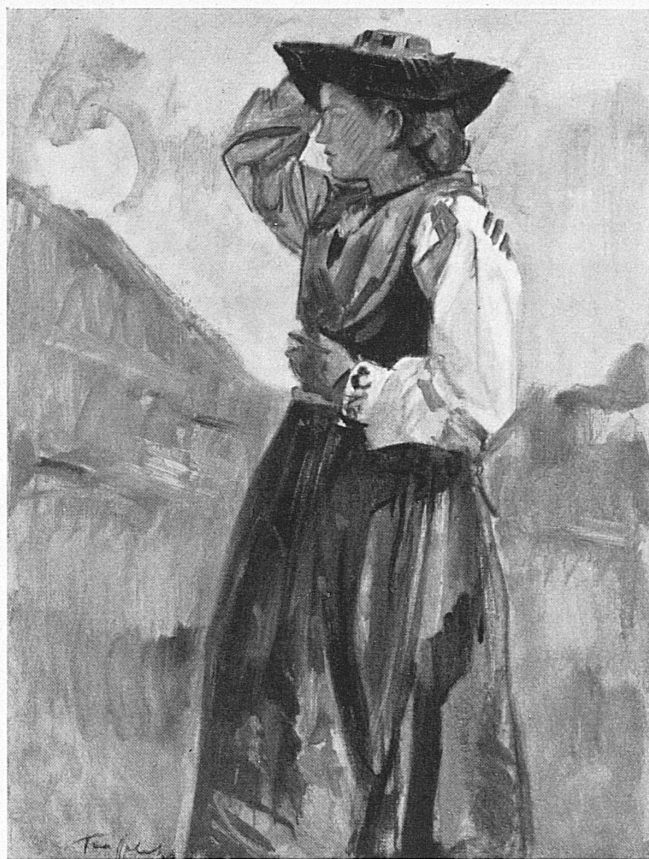
Walliserin in der Tracht. Valaisanne en costume.