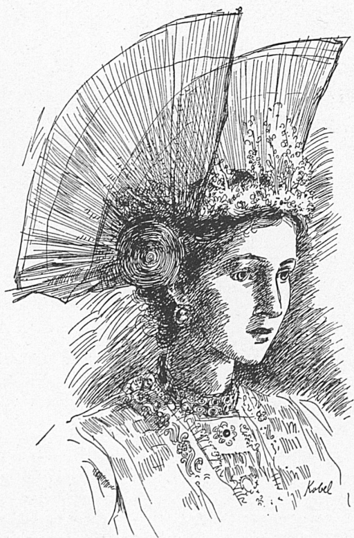
Tracht aus Innerrhoden.

Der Schweizer Held der Freiheit war und bleibt der Tell, und Arnold Winkelried mit seinem Opfertod steht neben ihm. Der heilige Klaus von Flüe aber wurde ihr Held der Liebe, die nach den Worten des Evangelisten das Größte ist unter ihnen.