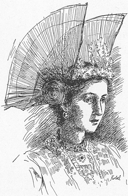
Tracht aus Innerrhoden.

Der Schweizer Held der Freiheit war und bleibt der Tell, und Arnold Winkelried mit seinem Opfertod steht neben ihm. Der heilige Klaus von Flüe aber wurde ihr Held der Liebe, die nach den Worten des Evangelisten das Größte ist unter ihnen.