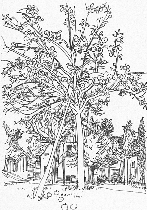
Zeichnungen von F. Krumenacher, R. E. Moser, H. Wetli.

An einem Herbsttage, der mit sanfter Sonne in der freundlichen Bläue des Himmels seine Helligkeit milde in die Bauernküche einließ, trat ich vor das Haus, lehnte mich an den steinernen Türpfosten und sah über den Hof. Wer zu solcher Stunde noch nie auf dem Lande weilte, der kennt die glashellen Herbsttage nicht, an denen sich bei Biswind und klarer Sonne der See in fast südlich azurner Bläue erstreckt wie ein grenzenloses, unabsehbares Gewässer, an dessen südlichem Rande dann die fernen Alpen in durchsichtig hauchzarter Zeichnung stehen. Gerade noch erkennt man sie an den hier und dort weiß-silbern schimmernden Schneehalden und Ewigschneekuppen, die aber auch wieder träge am Himmel lagernde weiße Wolken sein könnten, so innig verschmolzen und ineinanderrinnend sind die Konturen der himmelragenden Eisriesen und des herbstlichen Gewölks. Wie ein Buchhalter der Sonne scheint der Herbst kugelrund dazustehen, die Finger zwischen die Armlöcher der Weste gesteckt, weil er stolz ist auf die Fülle, die er zu geben vermag.