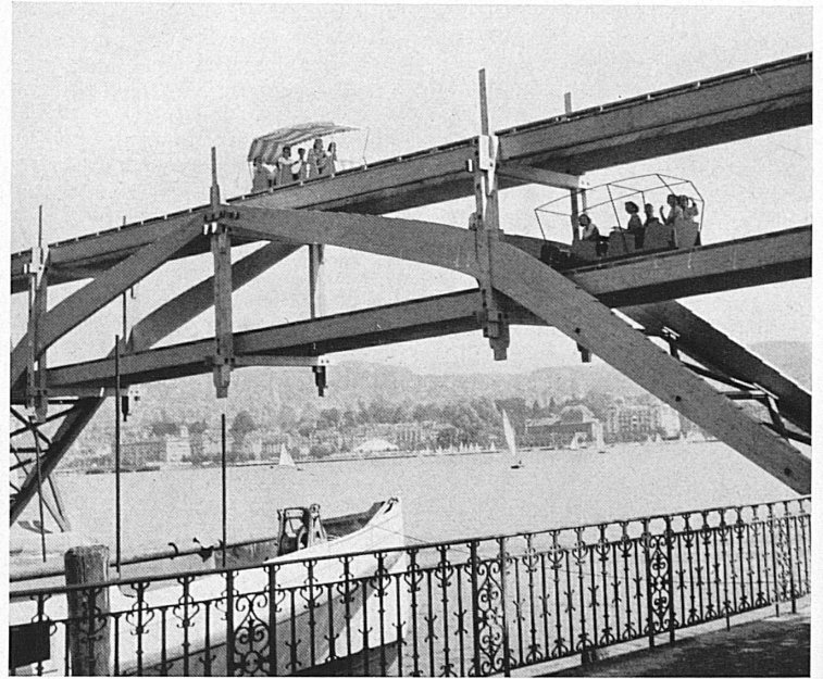
Links: Zürich im Festschmuck. — Oben: Die Ausstellungsbahn über dem Hafen Enge. — A gauche: La ville de Zurich parée pour la fête. — En haut: Les trains de la « Züka » au port d'Enge, à Zurich.