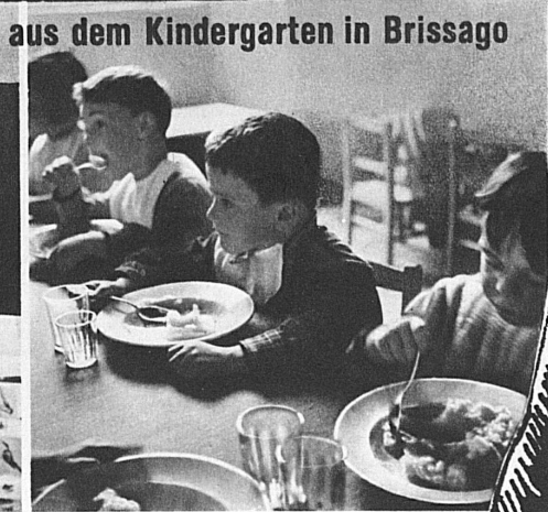
aus dem Kindergarten in Brissago