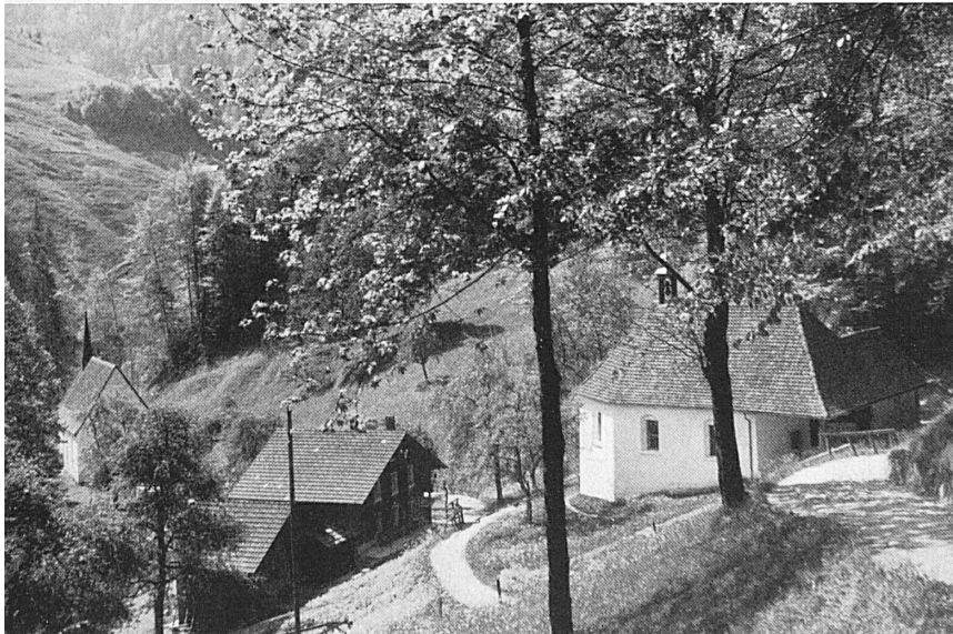
Links: Die Kapellen im Ranft. — A gauche: Les chapelles du Ranft. Photo: Gemmerli.

Links unten: Grabmal Bruder Klausens in der 1679 mit der Kirche zusammen neuerbauten Beinhauskapelle zu Sachseln. — Unten: Das älteste, 1945 wieder aufgefundene Bildnis des Heiligen (1492); es zierte die Außenseite eines Flügels des einstigen Hochaltars der Sachser Pfarrkirche. — A gauche, en bas: Tombeau de Nicolas de Flüe dans l'ossuaire de Sachseln, construit en même temps que l'Eglise en 1679. — En bas: Le plus ancien portrait du Saint (1492) retrouvé en 1945; il orna le côté extérieur d'une aile de l'ancien retable gothique de l'Eglise paroissiale de Sachseln. Photo: Gemmerli, F. Schwitler AG. (aus Zeitschrift für schweizerische Archäologie und Kunstgeschichte).