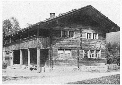
Links: An der Feier vom Pfingstsonntag in Sachseln wirkten u. a. auch die Grenadiere aus dem Lötschental mit. Die Bruderklausenstatue wird aus der Kirche getragen. — Oben: Das Geburtshaus Niklaus von Flües auf dem Flüeli. — A gauche: Le dimanche de Pentecôte, à Sachseln, les Grenadiers du Lötschental prêtèrent leur concours à l'occasion de la fête célébrée en l'honneur du Saint. On sort de l'Eglise la statue de Nicolas de Flüe. — En haut: La maison où naquit Nicolas de Flüe, à Flüeli.