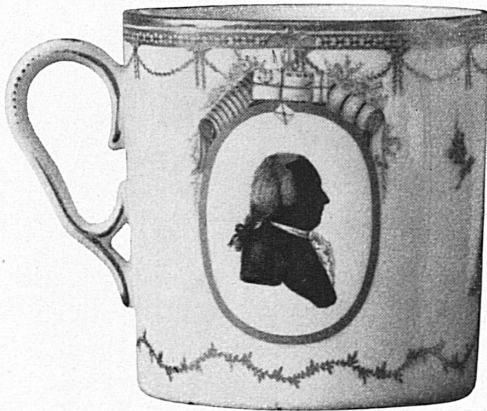
Au-dessus: Tasse provenant de la manufacture de Nyon et représentant le célèbre artisan et fabricant Moyse Bonnard.

A droite: Vase dit « Potpourri », avec couvercle ajouré pour feuillage séché odoriférant, à triple bordure de roses en camaïeu bleu. Fin XVIII me siècle.