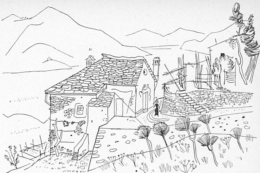
Oben: Ronco, hoch überm Ufer des Lago Maggiore.

En haut: Le petit village de Ronco, près d'Ascona et Locarno, domine les bords du Lac Majeur.