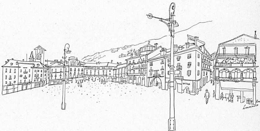
Der Hauptplatz von Locarno, La place du Marché, à Locarno.