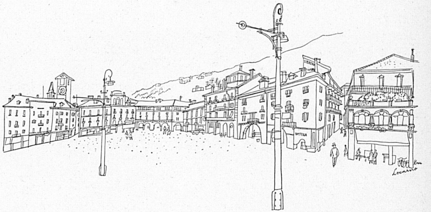
Der Hauptplatz von Locarno, La place du Marché, à Locarno.