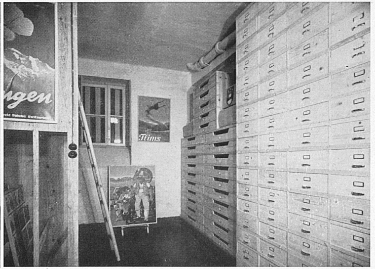
Dépôt de matériel (affiches - photos - diapositives - matériel de vitrines, etc.). — Materiallager.

ceci en raison de la rareté des devises et de la suspension des relations ferroviaires entre la France et l'Espagne. En dépit de ces conjonctures provisoirement défavorables, rien n'est négligé pour rappeler aux Espagnols les beautés de notre pays et le désir qui nous anime de bientôt les revoir parmi nous. Au Portugal tous les moyens dont nous disposons sont mis à la disposition de nos futurs hôtes qui ont