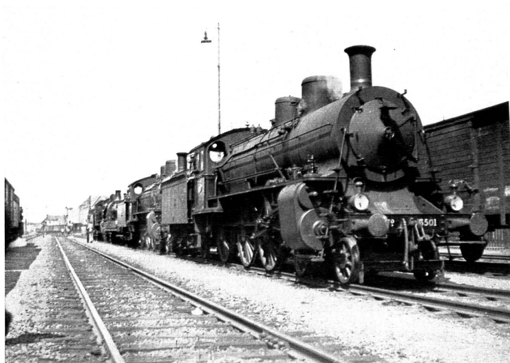
Zusammengekoppelt werden die prächtigen Schnellzugsmaschinen A 3/5, ihrem neuen Zwecke entgegengeführt. Les magnifiques locomotives express accouplées A 3/5, filent vers leur nouveau but.

schinen der Werkstätten und brandschatzten die Bahnhöfe, bevor sie sich vor den Alliierten zurückzogen.