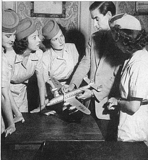
A gauche: Cours de familiarisation avec les différentes parties de l'avion. — Links: Am Modell werden die verschiedenen Teile des Übersee-Flugzeugs erläutert.