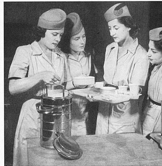
En haut: Cours pour le service de table. Les futures «hôtesses» s'exercent à un service prompt et soigné avec le matériel ad hoc en usage dans les avions: d'une part, un immense thermos contenant les aliments ou boissons et, d'autre part, un plateau en matière plastique comprenant des encoches dans lesquelles viennent se placer verres, assiettes, couverts, salières, etc. — Oben: Servierkurs der künftigen «Hostesses».