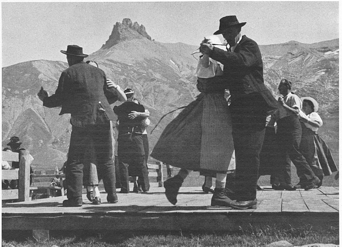
Rechts: « Bergdorfet » auf der Engstligenalp bei Adelboden. — A droite: La « mi-été » à l'Engstligenalp près d'Adelboden.

Auf das Fest soll auch der alte Unspunnen-Taler mit neuer Inschrift geprägt werden. Er kann bezogen werden: in Silber zum Preise von Fr. 5.— bei der Schweiz. Trachtenvereinigung, Heimethuus, Uraniabrücke, Zürich; in Gold (27 Gramm) zum Preise von Fr. 165.— bei der Bank Rüegg & Co. AG., Fraumünsterstraße 15, Zürich 1.