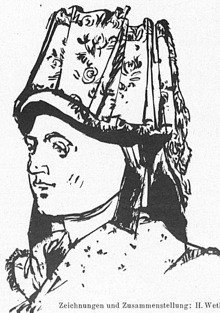
Zeichnungen und Zusammenstellung: H. Wetli, Genève.