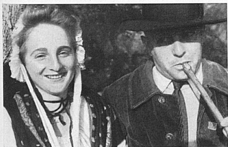
Costumes d'Avignon. Trachten aus Avignon.

La Saône avec ses vins aux parfums accentués de la Bourgogne, vins merveilleux que l'on déguste dans les festins où les tables sont chargées de mets, rejoint le Rhône à Lyon, la ville de la soie. Puis, le grand fleuve traverse des cités aux noms sonores : Valence, Avignon, et se jette dans la mer, entre des îles où broutent les taureaux à demi sauvages de la Camargue. Marseille est là, tout près, port immense, pour tout le pays