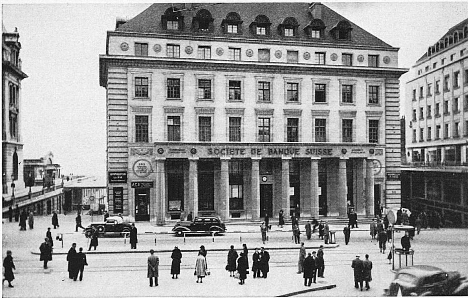
Hôtel de la banque à Lausanne