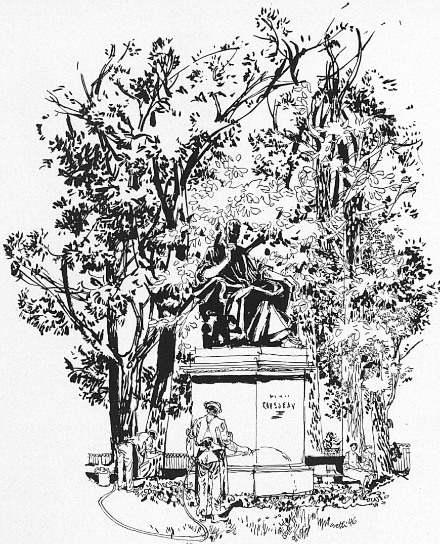
A gauche: Le monument Rousseau à Genève. — Links: Das Rousseau-Denkmal in Genf.