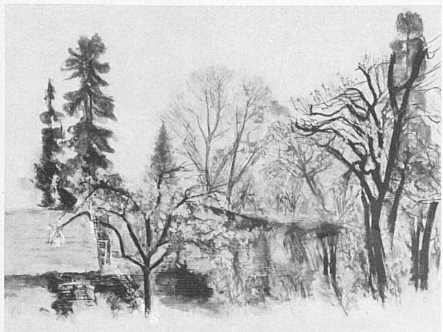
Links: «Herbst in Zürich», von R. Clemens. — Rechts, von oben nach unten: «Tanne am Ufer», von C. Paeschke. — «Bäume am Waldrand», von C. Paeschke. — A gauche: «Automne à Zurich», par R. Clemens. — A droite, du haut en bas: «Sapin au bord du lac», par C. Paeschke. — «Arbres à la lisière de forêt», par C. Paeschke.