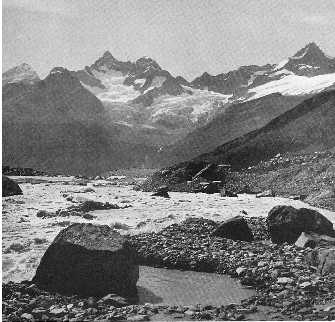
Oben: Am Findelenbach bei Zermatt; Blick gegen Dent Blanche, Obergabelhorn, Triftgletscher, Zinalrothorn. — Unten: Pappelreihen im Unterwallis. — En haut: Le Findelenbach près de Zermatt. Vue sur la Dent Blanche, l'Obergabelhorn, le Triftgletscher et le Zinalrothorn. — En bas: Rangées de peupliers dans le Bas-Valais.

Fondée en 1926 sur l'initiative généreuse du vénéré Gustave Tournier, lors de la commémoration du centenaire du premier pont suspendu de Marc Séguin unissant Tournon à Tain sur le Rhône, l'Union générale des Rhodaniens est une vaste association franco-suisse, englobant dans son sein toutes les régions sous l'influence du Rhône, de sa source à la Méditerranée, où il se jette, après avoir baigné plusieurs départements français. Son but est de créer et d'entretenir des liens d'amitié entre les régions, les populations et les cités rhodaniennes; d'exalter et de soutenir l'esprit rhodanien dans tout ce qui peut toucher aux idées, aux aspirations et aux créations les plus généreuses, aux réalisations et aux intérêts de toutes sortes des pays rhodaniens; de mettre en lumière et de développer toutes les gloires et toutes les fortunes des régions rhodaniennes. A cet effet, l'Union générale des Rhodaniens assure la perpétuation de fêtes périodiques et de congrès du Rhône; elle s'efforce de développer l'esprit et le régionalisme rhodaniens, de développer le tourisme, les sports, les arts, d'organiser toutes manifestations ayant trait à la vallée du Rhône, de s'occuper de la navigation et de l'aménagement du Rhône.