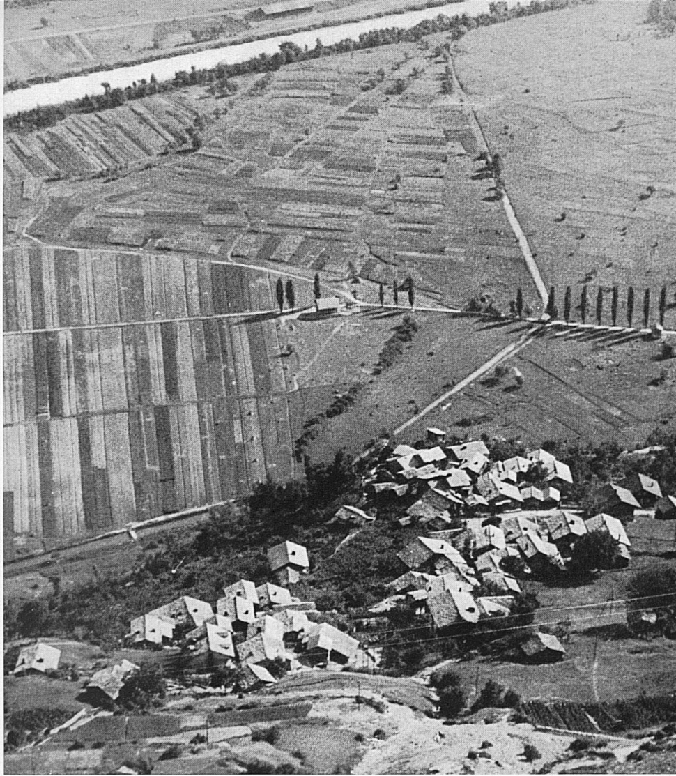
Oben: Das Rhonetal bei Visp. — Unten: Die junge Rhone im Goms. — En haut: La plaine du Rhône en aval de Viège. — En bas: Le Rhône dans la vallée de Conches.