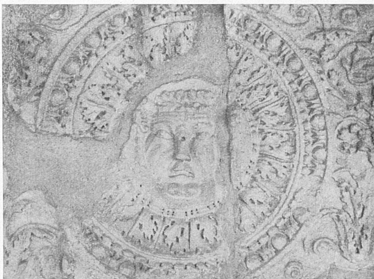
Vestiges de l'époque romaine à Avenches. — Reste römischer Altertümer in Avenches.