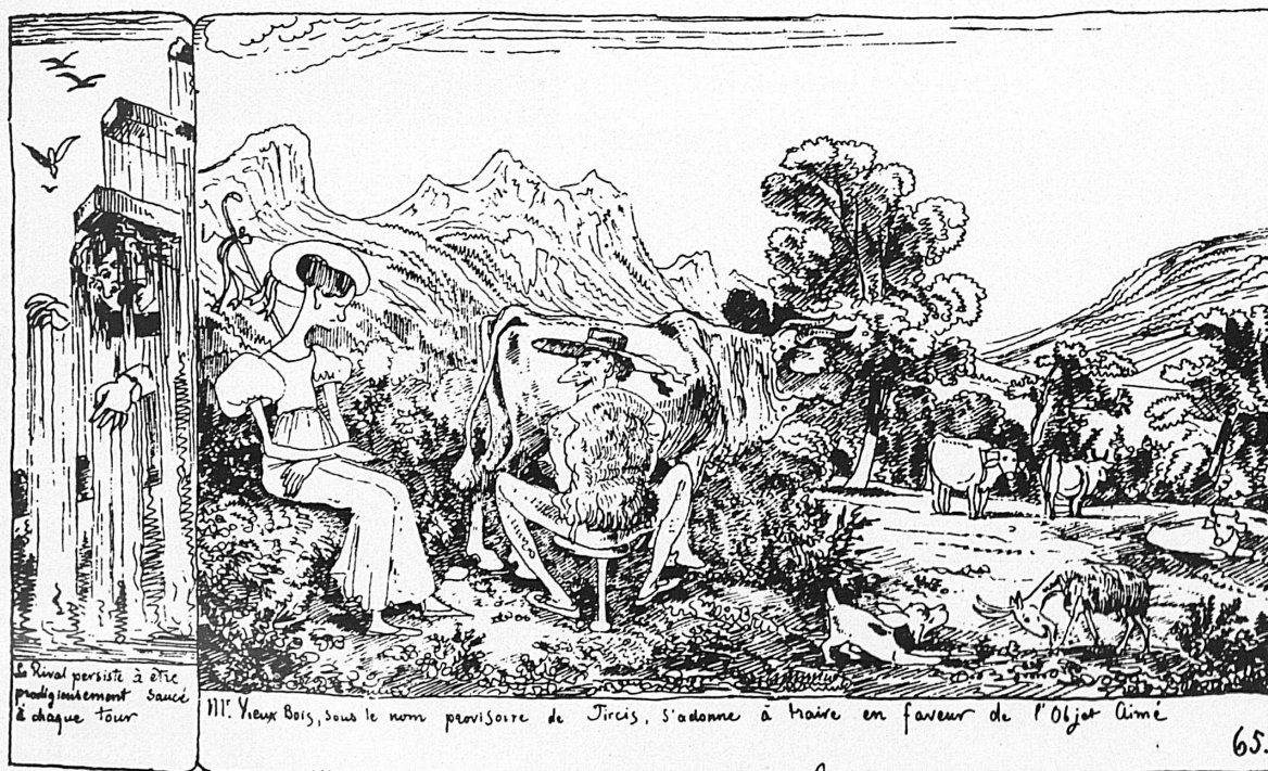
A gauche: Une page du délicieux album de « Monsieur Vieux-Bois ». — Links: Ein Blatt aus dem köstlichen Bilderroman « M. Vieux-Bois ». — En bas: Dessin original de Tœpffer, propriété de la Collection d'arts graphiques de l'Ecole polytechnique fédérale à Zurich, à laquelle nous sommes également redevables de la reproduction des autres illustrations. — Unten: Originalzeichnung Tœpffers im Besitz der graphischen Sammlung der Eidg. Technischen Hochschule in Zürich, der wir auch die Vorlagen zu den andern Bildern verdanken.

Le Rival persiste à être prodigieusement saoué à chaque tour