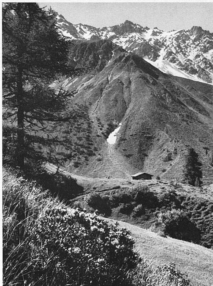
Les rhododendrons sont maintenant en pleine floraison. — Die Alpenrosen sind jetzt in voller Blüte.

Sans doute, cette fidélité est touchante et admirable. Elle est aussi quelque peu regrettable. Elle nous condamne à ignorer des mois qui nous