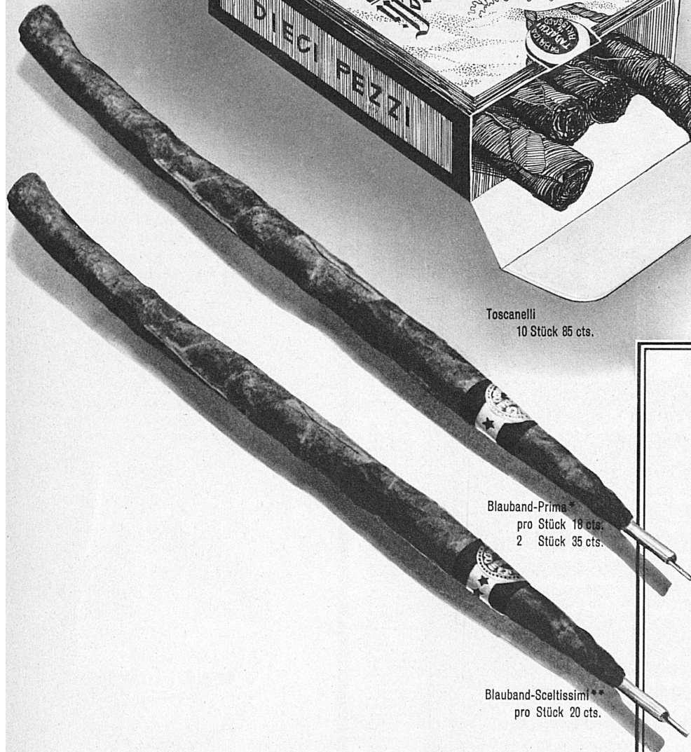
Blauband-Prima* pro Stück 18 cts. 2 Stück 35 cts.