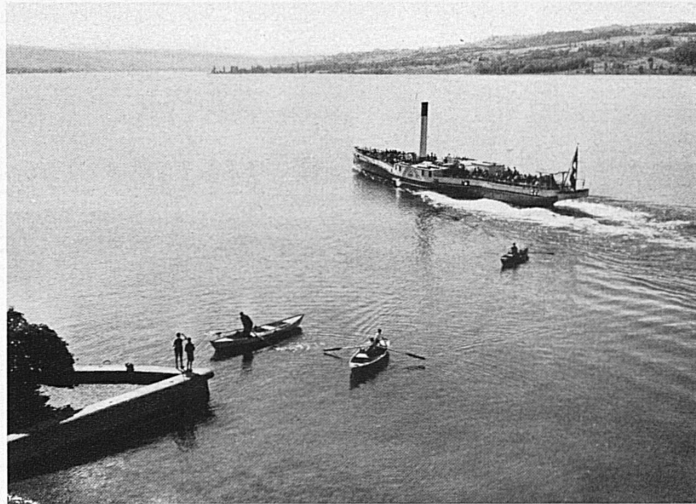
Sulle rive dell'Untersee presso Steckborn. — Am Untersee bei Steckborn.