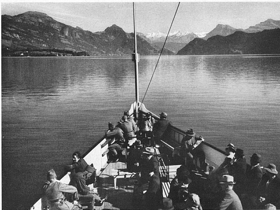
Sul lago dei Quattro Cantoni. — Auf dem Vierwaldstättersee.

Da quei capannoni ermeticamente chiusi s'odono durante l'inverno colpi di martelli e stridori di lime: i lindi... marinai estivi si sono trasformati in abili