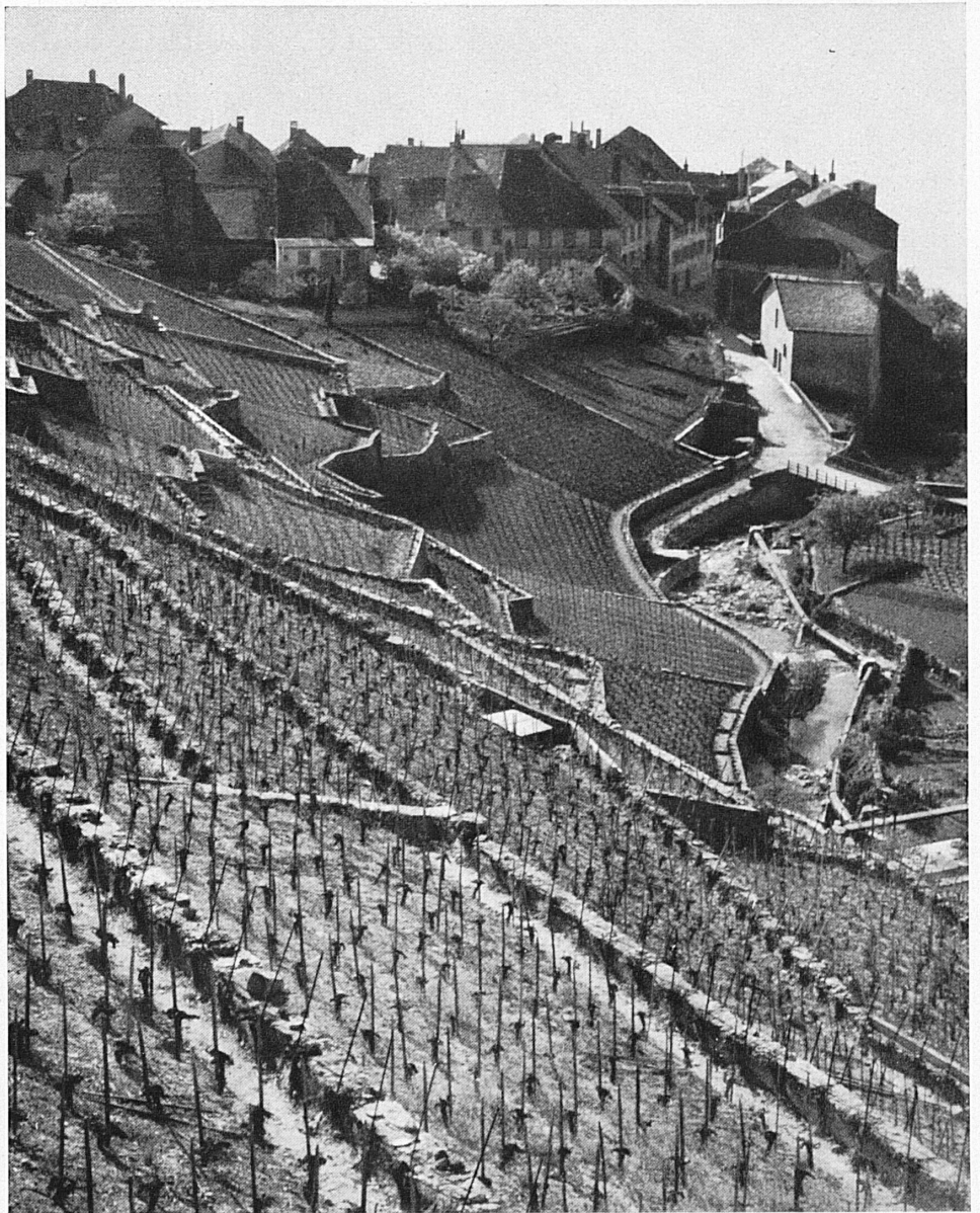
Frühlingsstimmung in Genf. Le printemps à Genève.