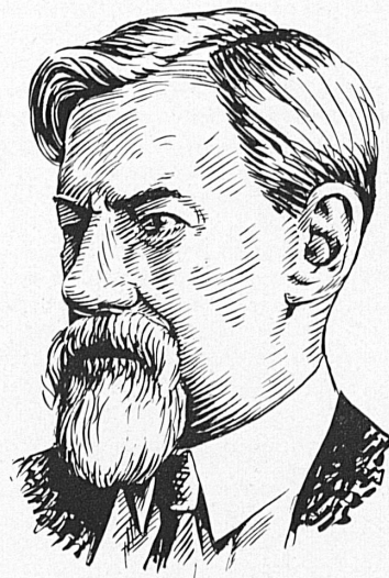
Edouard Claparède (1873–1940)

Die Ausbildung von Psychiatern und die wissenschaftliche Forschung sind in erster Linie die Aufgabe der sechs medizinischen Fakultäten der Schweiz. Ihr bedeutendster Vertreter auf dem Gebiete der Psychiatrie war Eugen Bleuler. Sein «Lehrbuch der Psychiatrie» ist weit über die Landesgrenzen hinaus bekannt und in verschiedene fremde Sprachen übersetzt worden. Die wissenschaftliche Tätigkeit findet ihren Niederschlag in einer Reihe von international bekannten Zeitschriften, vor allem dem «Schweizer Archiv für Psychiatrie», der «Monatsschrift für Psychiatrie» und der «Zeitschrift für Kinderpsychiatrie».