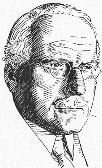
Carl Gustav Jung (geb. 1875)

Die Ausbildung zum Spezialisten ist durch die verbindlichen Vorschriften der Gesellschaft der Schweizer Ärzte geregelt. Der Titel eines Spezialarztes für Psychiatrie wird einem Arzt erst dann zuerkannt, wenn er sich nach absolviertem Staatsexamen während drei Jahren an einer psychiatrischen Klinik und während eines Jahres an einer medizinischen Klinik für seine Tätigkeit vorbereitet hat. Sämtliche Leiter der psychiatrischen Privatkliniken sind Inhaber des Spezialistendiploms.