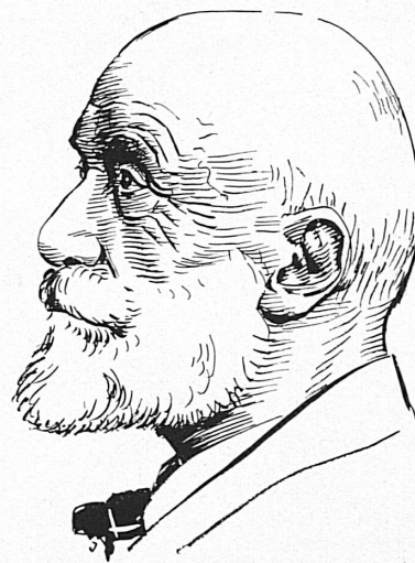
Auguste Forel (1848–1931)

Innerhalb der allgemeinen Entwicklung der psychiatrischen Lehre und Forschung, die sich seit einem Jahrhundert vollzogen hat, haben eine Reihe von Schweizer Ärzten europäische Geltung erlangt. Die schweizerische psychiatrische Schule, die durch sie begründet wurde, zeichnet sich dadurch aus, daß sie neben der Verfolgung ihrer eigenen Forschungsziele an allen wissenschaftlichen Fortschritten im Ausland lebhaften Anteil nimmt und sie der praktischen ärztlichen Tätigkeit nutzbar zu machen sucht.