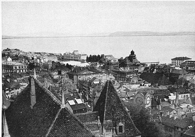
La ville, vue du château. Blick vom Schloß aus über die Stadt.

La pittoresque maison du Trésor, dans la vieille ville de Neuchâtel, a été récemment restaurée avec beaucoup de goût. Les boutiques du rez-de-chaussée ont été ornées de charmantes enseignes de fer forgé.