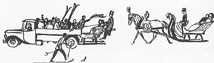
Zeichnungen von Robert Zuberbühler.

konnte innerhalb seiner kleineren Distanzen einen geordneten Schlittenbetrieb einrichten, der zwischen Davos-Platz und Davos-Dorf besteht und am Sonntag billig die Autobusse ersetzt. Aber was hier unter ganz besonderen Verhältnissen (es handelt sich um eine ebene und kurze Strecke) möglich war, war es andernorts nicht. Das Toggenburg hofft sich nun auf weite Sicht helfen zu können, indem es sich mit allen Mitteln für die geplante Ver-