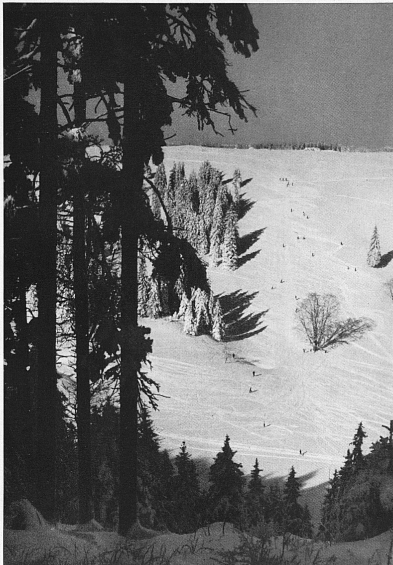
Le Jura neuchâtelois, près de la Vue des Alpes.* Die prachtvollen Hänge im Neuenburger Jura, in der Gegend der Vue des Alpes.