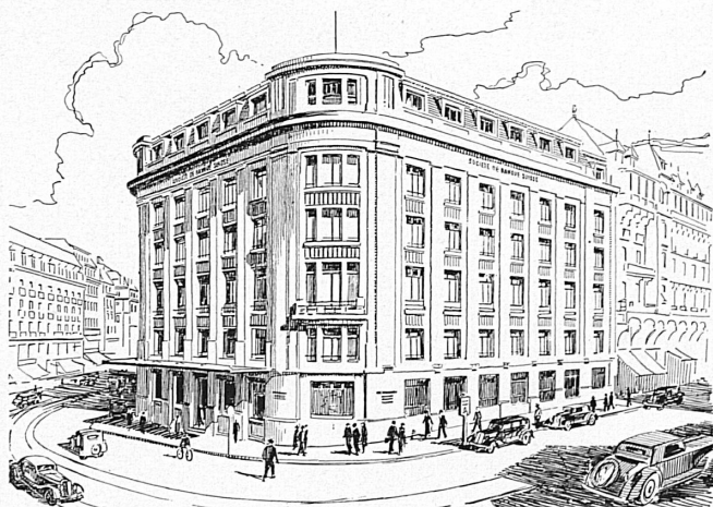
Hôtel de la banque à Genève — Bankgebäude in Genf