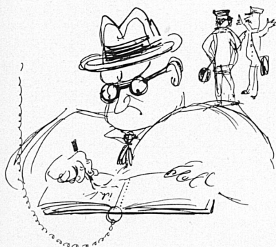
Beschwerde — Scheckbuch. Livre des réclamations.

Le concours que les C. F. F. organisèrent au début de l'année sous le titre: «Pour esprits fertiles», prouva tout d'abord combien il est difficile de choisir 200 lauréats parmi 6121 participants, mais aussi démontra une nouvelle fois de combien de sympathies nos C. F. F. jouissent