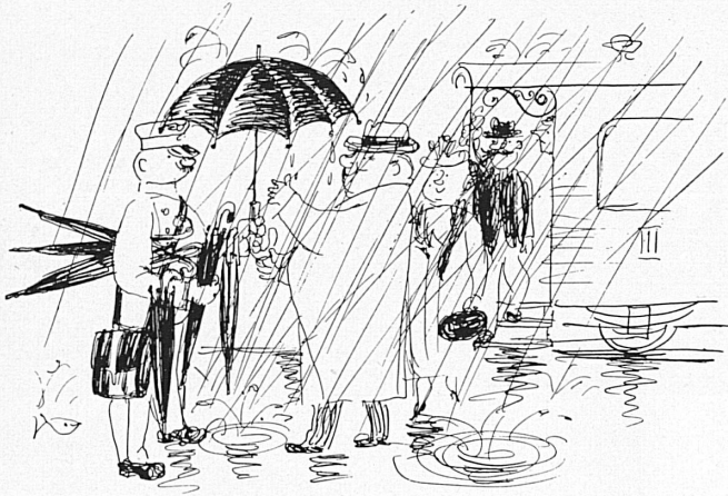
Ausleihe von vergessenen Regenschirmen an Bahnkunden. Prêt de parapluies aux voyageurs.