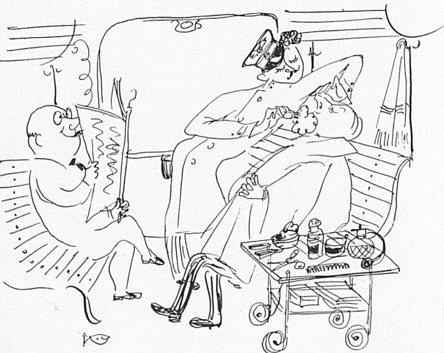
Abteil mit Coiffeurbedienung. Salon de coiffure.

Der unter dem Motto «Für findige Köpfe» zu Beginn dieses Jahres von den Schweizerischen Bundesbahnen veranstaltete Wettbewerb hat, so schwer es im einzelnen fallen mochte, unter den 6121 Teilnehmern die 200 eines Preises Würdigen zu bestimmen, einmal mehr gezeigt, welcher Sympathien sich die Eisenbahn in unserm Volke erfreuen darf. Oft wird Kritik geübt, gewiß, aber mehrheitlich gleich auch in wohlwollendem Sinne mit Anregungen verknüpft; die Möglichkeit nun, gleich eine ganze Reihe derartiger Wünsche und Vorschläge vorgelegt zu erhalten, zu vergleichen und auf ihre Verwertbarkeit prüfen zu können, schuf eine denkbar günstige Gelegenheit, sich von den Ansichten des reisenden Publikums in großem Umfang ein Bild zu machen.