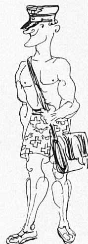
Leichtere Sommerkleidung für das Personal! Tenue estivale pour le personnel.

Cependant, si le second point du concours présentait le plus d'intérêt aux yeux de la direction générale des C. F. F., le premier point fit naître un grand nombre de manifestations spontanées à l'endroit de ceux qui sont responsables de la bonne marche des C. F. F. Par lettres ou par dessins, en prose ou en vers, on y soulignait le confort et la quiétude des voyages, la propreté, l'exactitude, l'esprit social qui s'y montre dans tous les domaines possibles, les perfectionnements de l'horaire; le personnel, parfaitement à son affaire et poli, y était glorifié à souhait. Bref! cet éloge démontre la valeur des C. F. F., la satisfaction que lui témoigne le peuple — ce qui n'oblige pas moins nos autorités à prolonger encore leur ouvrage et d'en rechercher la perfection.