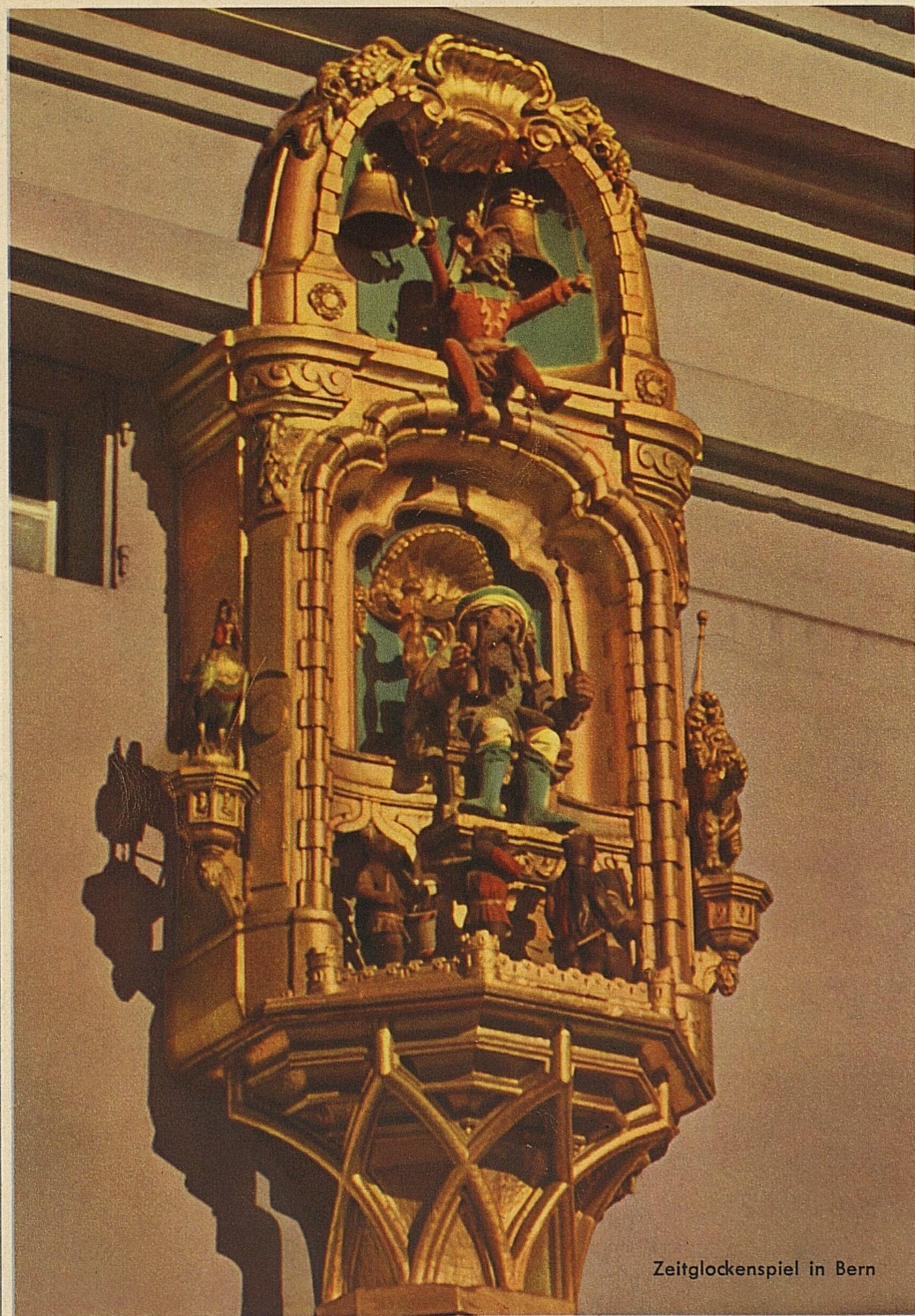
Zeitglockenspiel in Bern