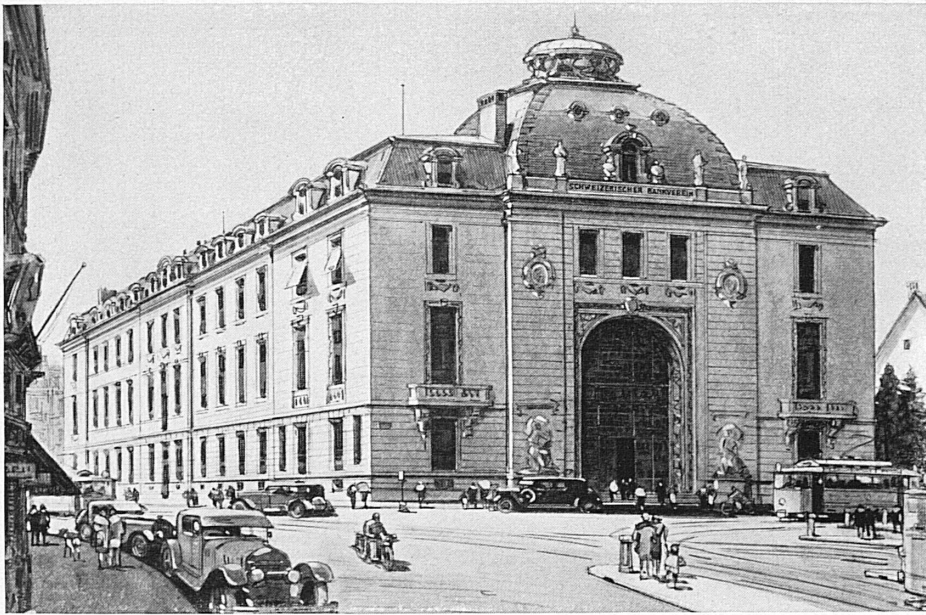
Bankgebäude in Zürich - Hôtel de la banque à Zurich