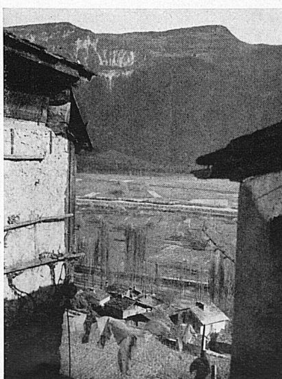
Echappée sur la Vallée. Blick ins ebene Tal.*