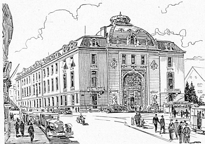
Bankgebäude in Zürich — Hôtel de la banque à Zürich