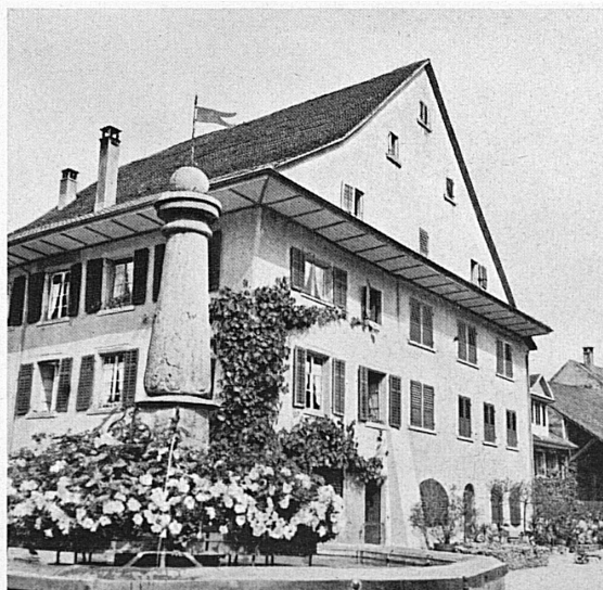
Rechts, von oben nach unten: Straßenbild aus Zurzach. — Ehemalige Stiftspropstei, heute Schulhaus. — Plastik vom Eingang eines der Messehäuser. — Motiv aus Zurzach.