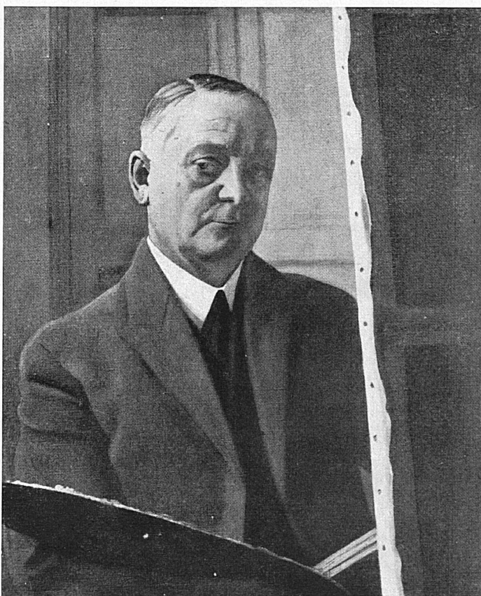
Paysage, par Félix Vallotton. — Félix Vallotton : Portrait de l'artiste.