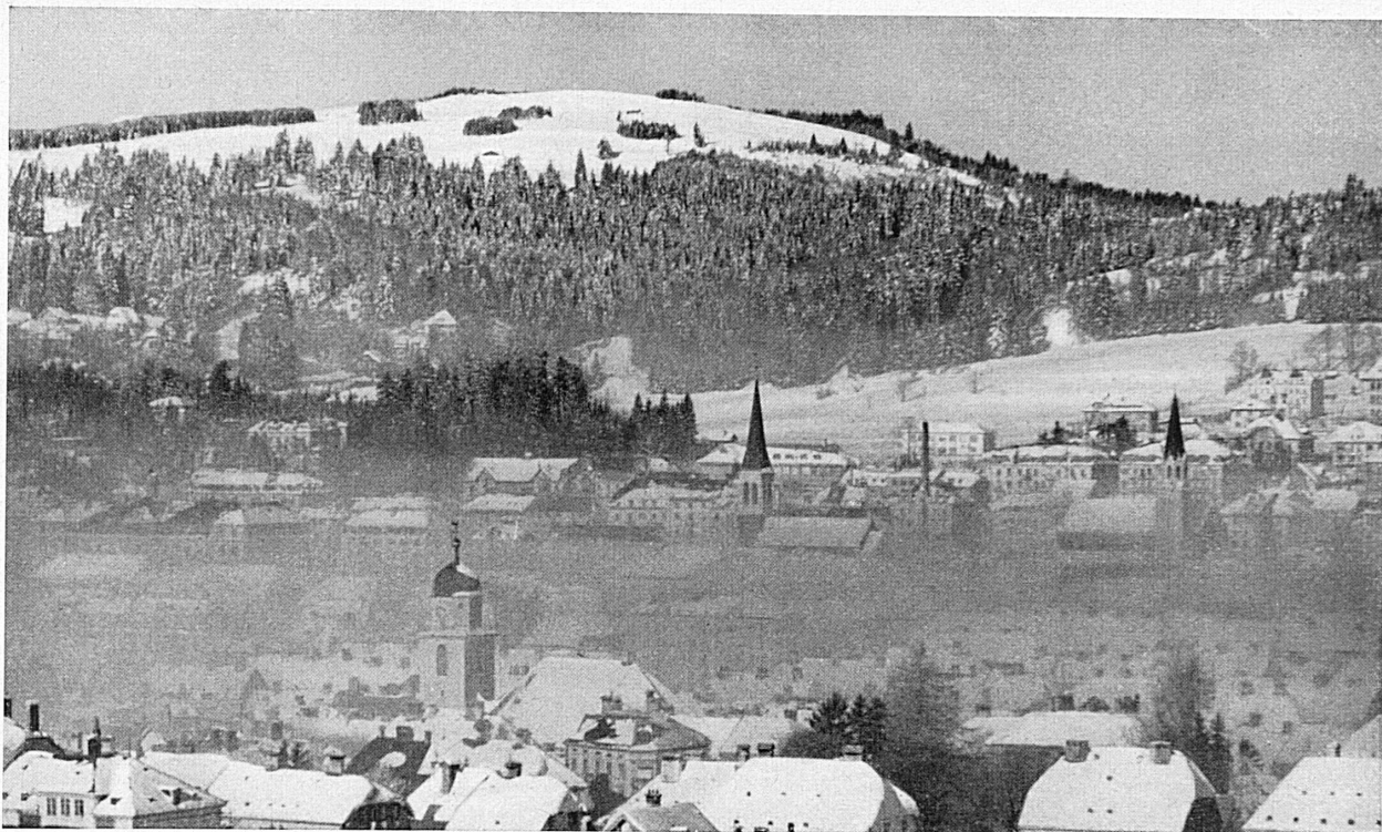
La Chaux-de-Fonds en hiver. — Winterliches La Chaux-de-Fonds.*