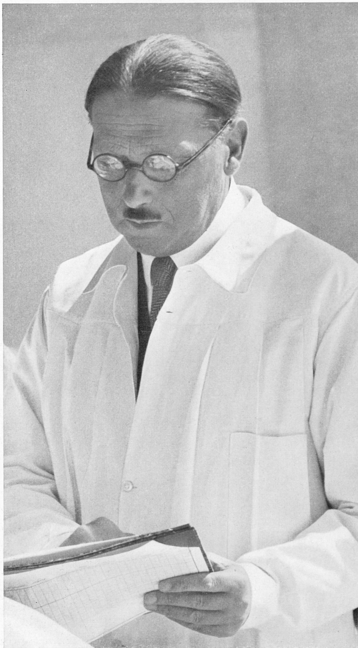
Prof. Auguste Rollier.