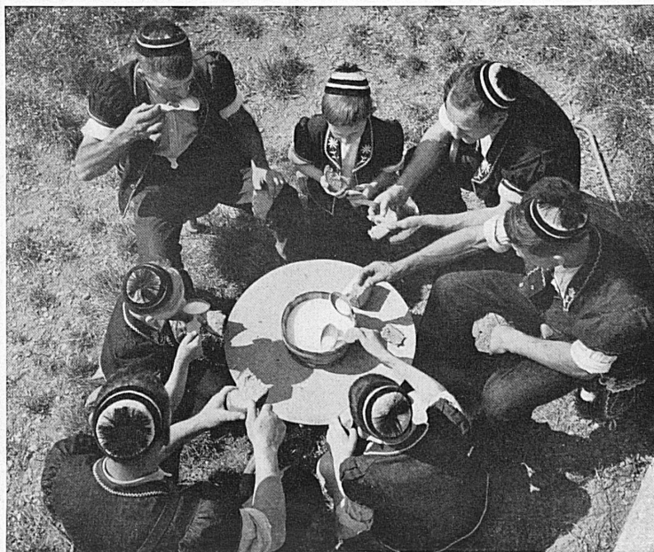
Réunis autour du seillon de lait, assis qui par terre qui sur un tabouret à traire, armaillis et « bouébos » prennent leur premier repas en commun. Sennen und Buben bei der ersten Mahlzeit auf der Alp.