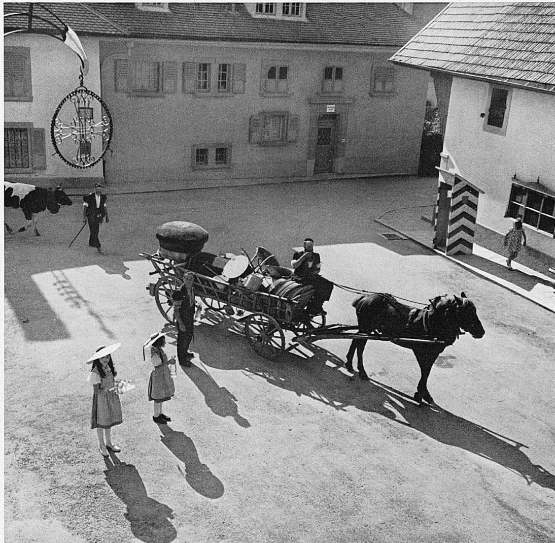
Une jolie tradition : la verrée offerte, sur la place du village, aux armaillis au moment où ils partent pour l'alpage. Ein hübscher Brauch : Der Trunk, der den Sennen vor der Alpfahrt geboten wird.