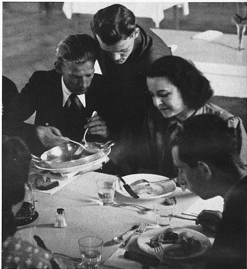
Les élèves préparent et servent eux-mêmes leurs repas. — Die Schüler bereiten und servieren das Essen selbst.