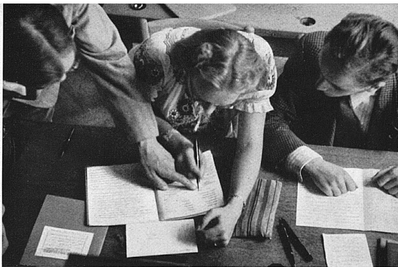
Les cours sont mixtes. Les futures hôtelières ne sont pas les moins studieuses. — Töchter und junge Leute werden gemeinsam ausgebildet. Die zukünftigen Hotelleiterinnen zeigen besonderen Eifer.

Optimismus gerechtfertigt und dem Ruf sogar über Erwarten freudig Folge geleistet. Im Interesse der Zukunft unseres Gastgewerbes und unseres gesamten Fremdenverkehrs ist der umsichtig geleiteten Fachschule des Schweizer Hoteliervereins weiterhin ein mächtiger Zuspruch und eine rasche Entwicklung zu wünschen.