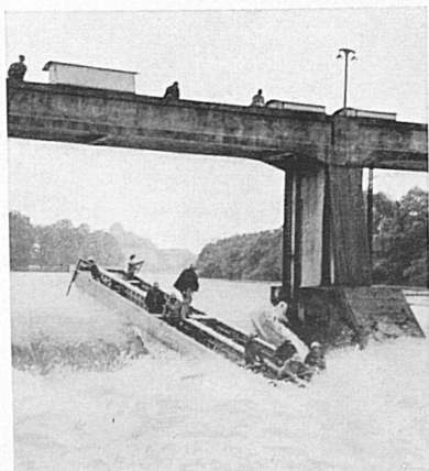
Durchfahrt durch ein Stauwehr (Zensur Nr. V/730).