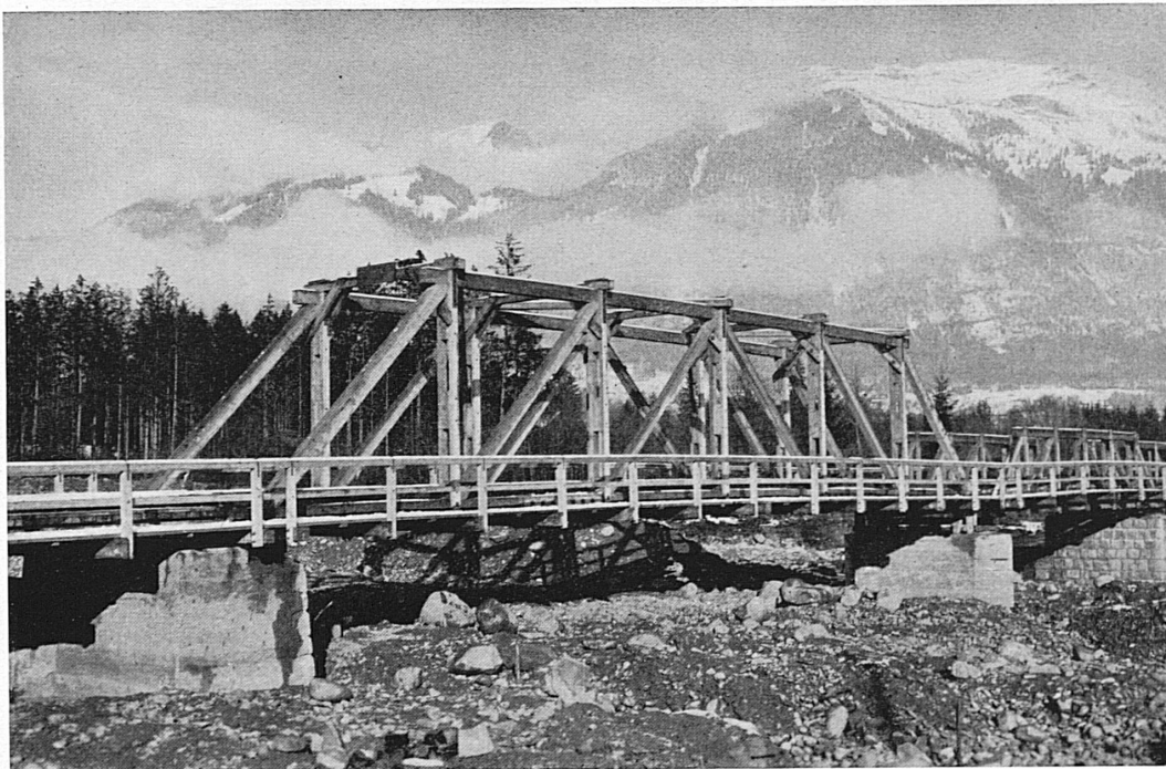
Durch Pontoniere erbaute Straßenbrücke über die Große Schlieren in Obwalden (Zensur Nr. V/728).