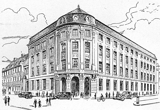
Bankgebäude in Basel — Hôtel de la banque à Bâle

☆ SCHWEIZERISCHER BANKVEREIN ☆ SOCIÉTÉ DE BANQUE SUISSE ☆ SOCIETÀ DI BANCA SVIZZERA ☆ SWISS BANK CORPORATION ☆ SOCIÉTÉ DE BANQUE SUISSE ☆